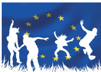
Servizio Volontario Europeo

Sito del concorso: ec.europa.eu/translatores