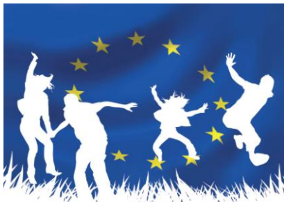
Servizio Volontario Europeo

Sito del concorso: ec.europa.eu/translatores